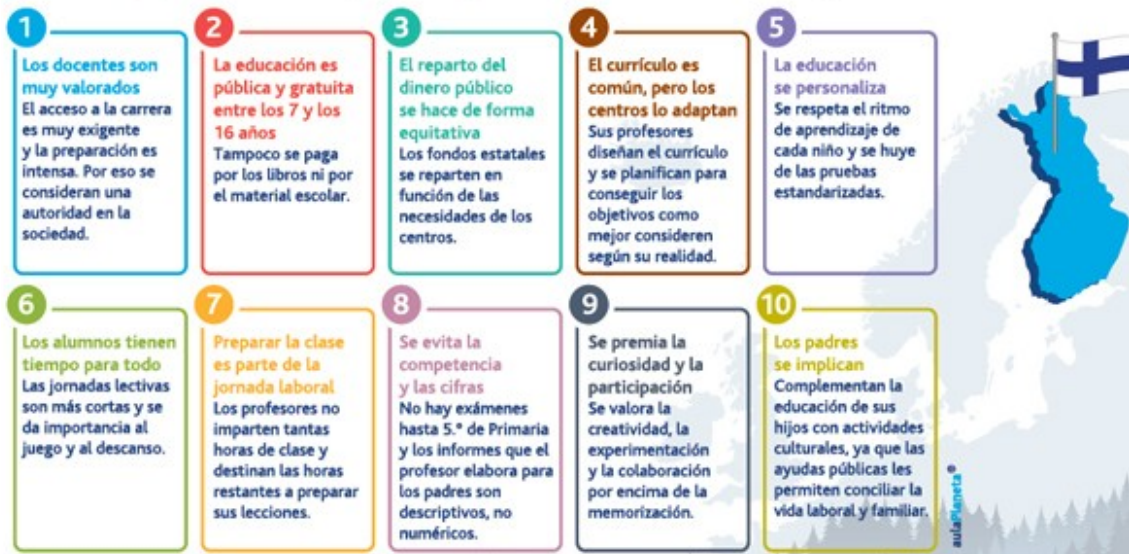
Ilustración 310 claves de la educación en Finlandia.

El sistema educativo finlandés está considerado uno de los mejores del mundo. Te explicamos algunas características esenciales que pueden contribuir a explicar su éxito y servirnos para reflexionar sobre nuestro propio sistema de enseñanza.