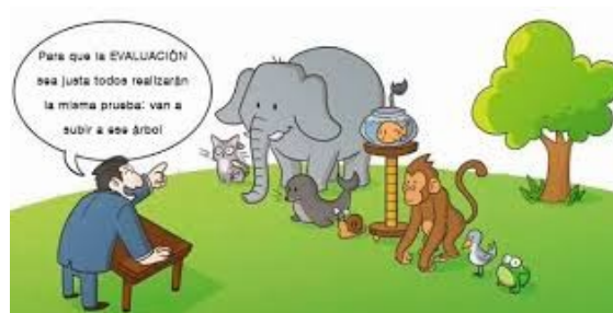
Ilustración 2. Educación Justa. Fuente Miguel Ángel Santos Guerra

La falencia común cometida es la evaluación no valorizada y justa según las capacidades del estudiantes; Paraguay y países de América, con esta imagen del español, psicólogo, catedrático Miguel Ángel Santos Guerra, pretende mostrar la ES actual y la evaluación Justa