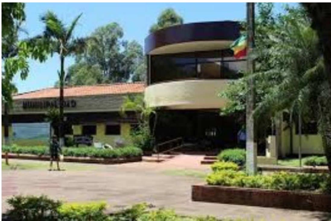
Municipalidad de Coronel Bogado